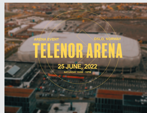
Bli med på The Send!

Det blir en dag med lovsang, taler, bønn, stands og mer. Det spennende med «The send» er at det er ikke bare denne dagen, det viktigste skjer etterpå. I løpet av lørdagen vil alle bli invitert til å engasjere seg i et eller flere områder. På to av disse er Acta koblet på og kommer til å følge opp en del av ungdommene som melder seg. På «Nabolag» utfordres ungdom til å bidra i et ungdomsarbeid eller starte et ungdomsarbeid der de bor, mens på «Folkeslagene» utfordres de til misjonstur, misjonsskole (f.eks Gå ut senteret) eller å bli misjonær. Vi gleder oss til å se hva Gud har planlagt med The Send.