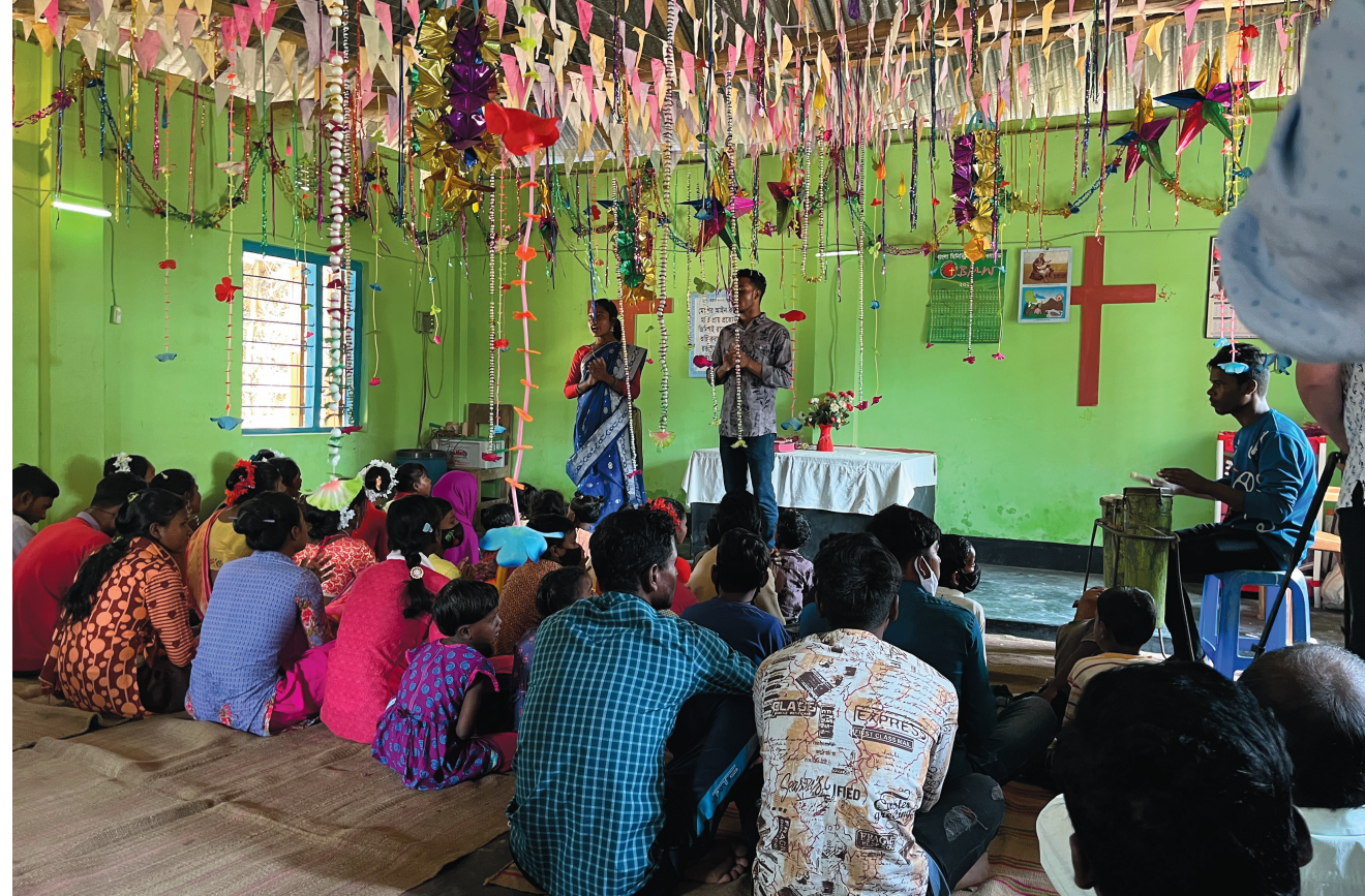
Søndagsskole i Dorgapara

Vi kom til et åpent område med en kirke, noen hus og skolebygget. Dette tilbudet gir jenter opplæring i søm, slik at de kan få en jobb. De er der i fire måneder og bor da på internat på samme sted. I tillegg er det også en bibelskole. Når de er ferdig, blir de sponset med to tredjedeler av en symaskin, så de betaler en tredjedel av prisen. Store deler av skolen blir også dekket, de betaler kun en liten egenandel. Her snakket vi med